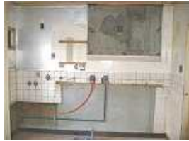
壁の下地・配管が見えています