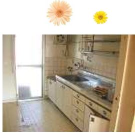
組合せキッチン撤去前