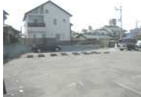
金岡町建築予定地

今年のギミックデザイン 一番の物件の かなおかヴィレッジの 図面が完成しました。これからは、各工事の見積を依頼して 業者を検討・決定して行きます。 廻りに賃貸の集合住宅は、たくさんありますが どれも違う 外観&内装の賃貸になる予定ですので ご期待ください。