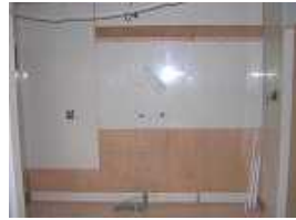
壁仕上は流行のキッチンパネル貼り